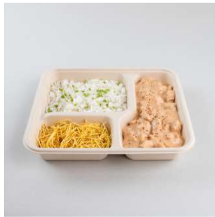
Marmita 1000ml c/ 3 divisórias