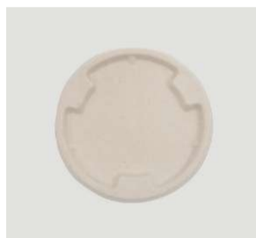
Tampa p/ pote 500ml

Cód. PO3 Tamanho (cm): Ø 13, x 7,1 altura