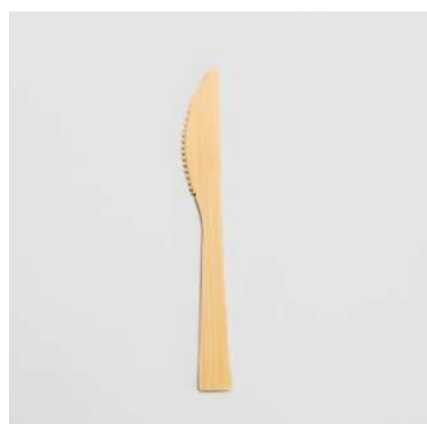
Faca de bambu