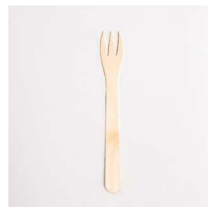
Garfo de madeira p/ petisco