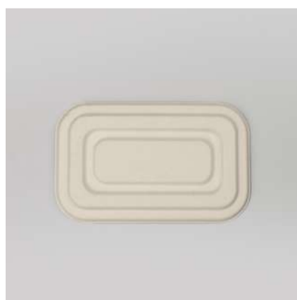
Tampa p/ bandeja 400ml

Cód. BA400 Tamanho (cm): 19 x 11,6 x 3,5