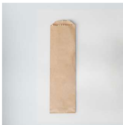
Saco kraft p/ talheres