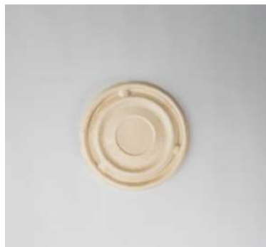
Tampa p/ pote 250ml e 350ml