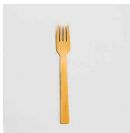
Garfo de bambu