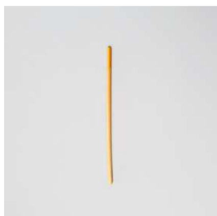
Canudo de talo de trigo 5mm

Canudos de diferentes espessuras para acompanhar diferentes tipos de bebidas.