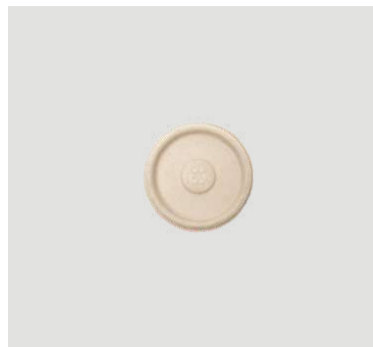
Tampa p/ pote 55ml