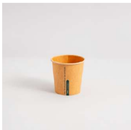
Copo kraft 100ml

Biodegradáveis de verdade. Copos de 4 tamanhos diferentes, com ou sem tampas. Mexedores de bambu para bebidas, avulsos ou embalados individualmente.