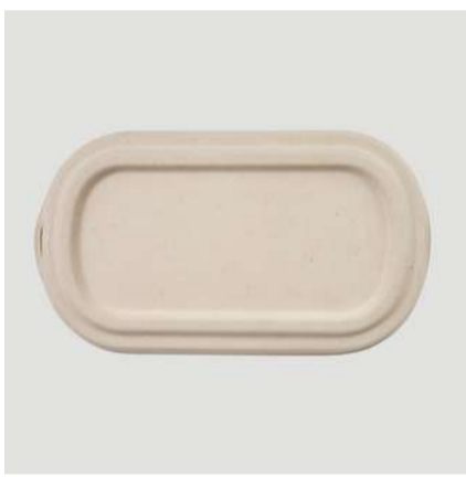
Tampa p/ marmitas 850ml

Cód. MA2 Tamanho (cm): 23,3 x 13,3 x 4,7