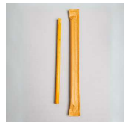
Canudo de cana 9mm embalado individualmente

Cód. CA2 Comprimento (cm): 18 Espessura (mm): entre 6 e 8