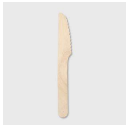
Faca de madeira