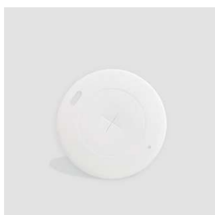
Tampa de papel p/ copo 240ml

Cód. CP240 Tamanho (cm): Ø 7,9 x 9.1 altura