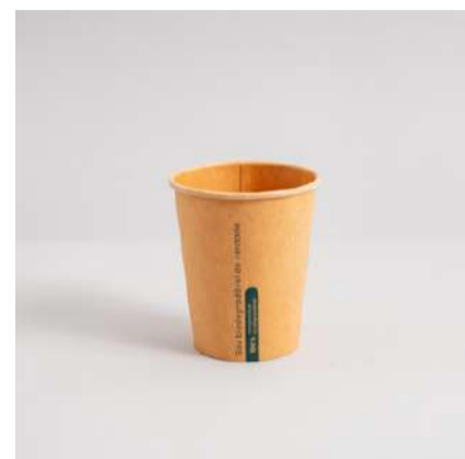
Copo kraft 240ml

Cód. CP240 Tamanho (cm): Ø 7,9 x 9.1 altura