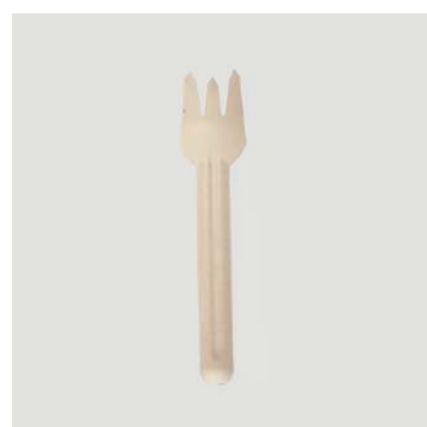
Garfo de fibras de plantas