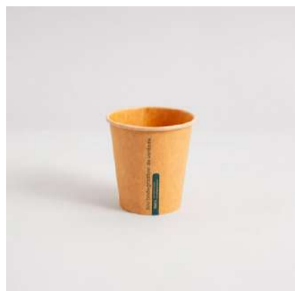
Copo kraft 180ml

Cód. CP180 Tamanho (cm): Ø 7,3 x 7,6 altura