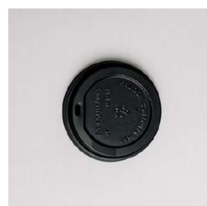
Tampa p/ copo kraft 300ml

Cód. CP300 Tamanho (cm): Ø 9,1 x 9,5 altura