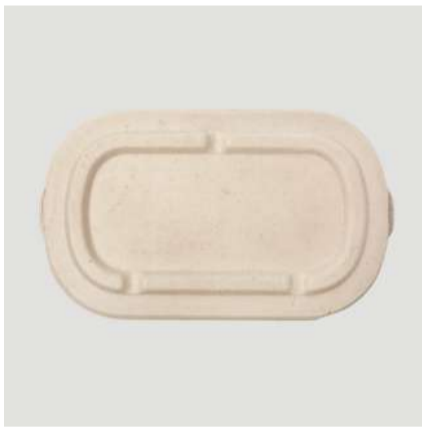
Tampa p/ marmita 1000ml