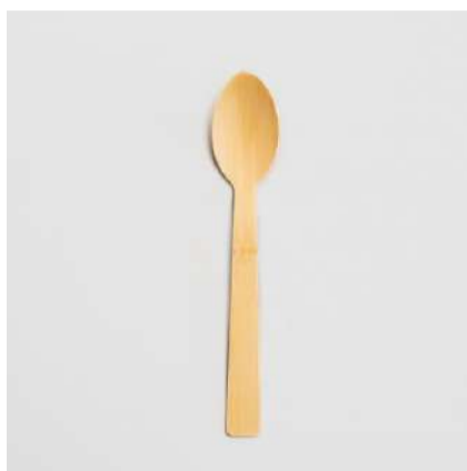
Colher de bambu