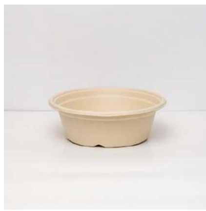
Marmita redonda 900ml