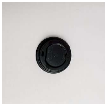
Tampa p/ copo 180ml

Cód. CP180 Tamanho (cm): Ø 7,3 x 7,6 altura