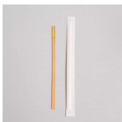
Mexedor bambu embalado individualmente