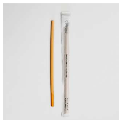
Canudo de cana 7mm embalado individualmente

Cód. CA1 Comprimento (cm): 20 Espessura (mm): entre 4 e 6