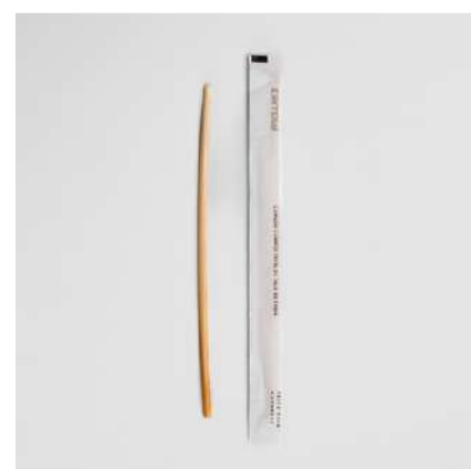
Canudo de talo de trigo 5mm embalado individualmente

Cód. CA0 Comprimento (cm): 20 Espessura (mm): entre 4 e 6