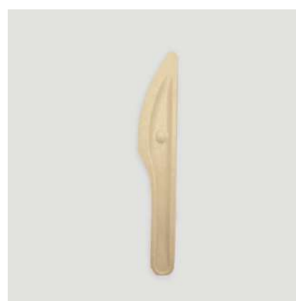
Faca de fibras de plantas