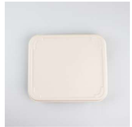
Tampa p/ marmita 1000ml