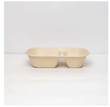
Marmita 850ml c/ divisória

Cód. MA1 Tamanho (cm): 23,3 x 13,3 x 4,7