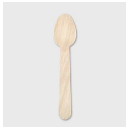
Colher de madeira