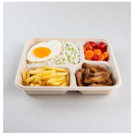
Marmita 1000ml c/ 4 divisórias