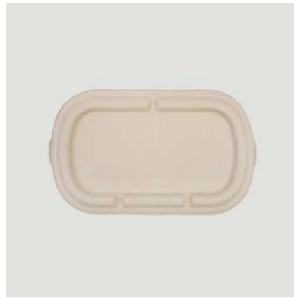
Tampa p/ marmita 500ml