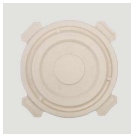
Tampa p/ marmita 900ml, bowl 750ml e 1050ml