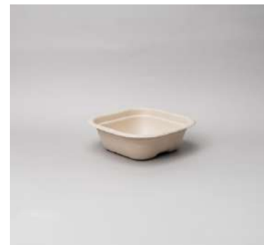
Pote 300ml quadrado