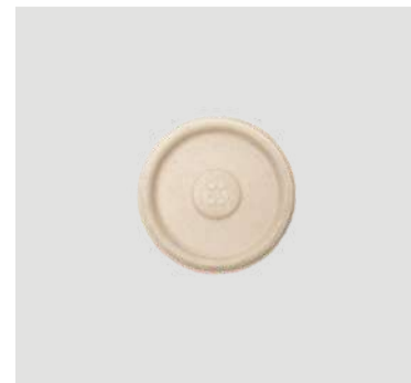
Tampa p/ pote 140ml

Cód. PO2 Tamanho (cm): 7,7 Ø x 5,4 altura