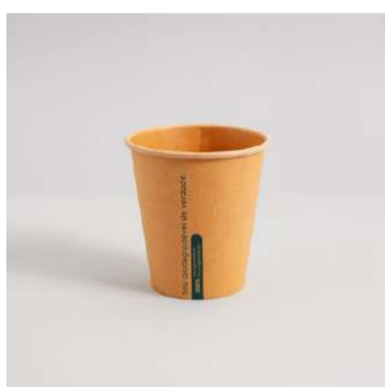
Copo kraft 300ml

Cód. CP300 Tamanho (cm): Ø 9,1 x 9,5 altura