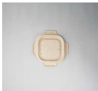
Tampa p/ pote 300ml quadrado