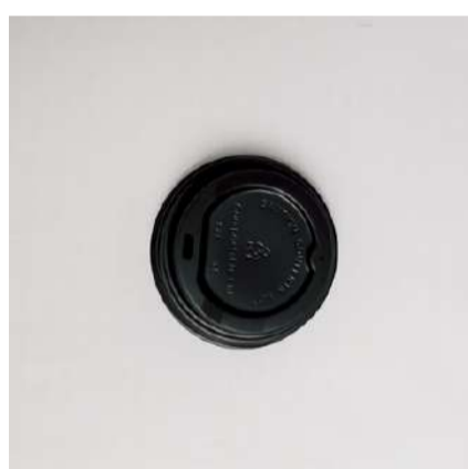
Tampa p/ copo kraft 240ml

Cód. TCP240 Tamanho (cm): Ø 8,5 x 1,5 altura Ideal para copos com a boca de 8cm de diâmetro