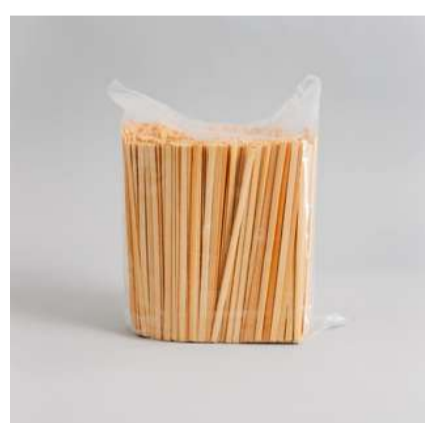
Mexedor de bambu